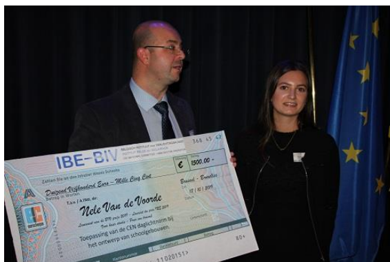
Overhandiging van de BIV Prijs door de voorzitter