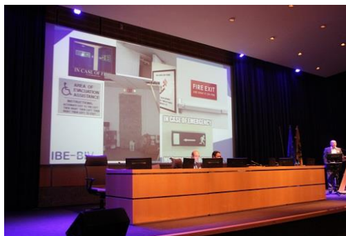
De Zaal en het publiek